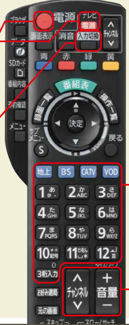
デジタルホームターミナルリモコン