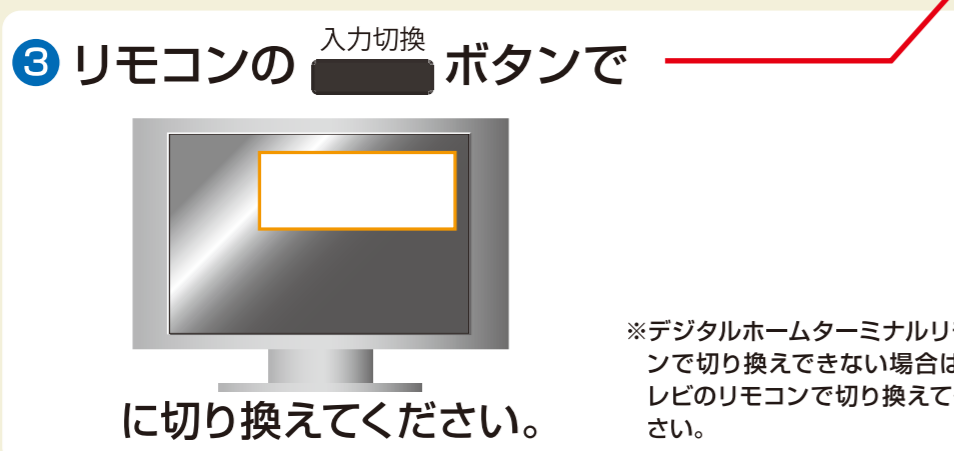
デジタルホームターミナルリモコン